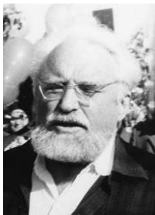
А.Д. Александров. 1979

Вы прислали мне «цитату» из Маркса: «В своей действительности личность есть совокупность всех обществ. отнош.» (МЭ т. 3, стр 3).