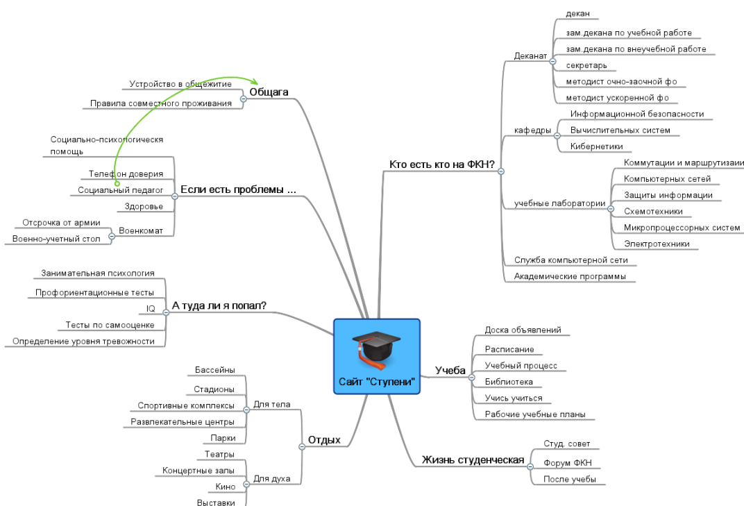
Рис. 2. Интеллект-карта структуры сайта «Ступени»

ветвями, отходящими от центрального понятия или идеи. В основе этой техники лежит принцип «радиантного мышления», относящийся к ассоциативным мыслительным процессам, отправной точкой или точкой приложения которых является центральный объект. Радиант — точка небесной сферы, из которой как бы исходят видимые пути тел с одинаково направленными скоростями, например метеоров одного потока. Это показывает бесконечное разнообразие возможных ассоциаций и, следовательно, неисчерпаемость возможностей мозга. Подобный способ записи позволяет диаграмме связей неограниченно расти и дополняться. Диаграммы связей используются для создания, визуализации, структуризации и классификации идей, а также как средство для обучения, организации, решения задач, принятия решений, при написании статей. Иногда в русских переводах термин может переводиться как «карты ума», «карты разума», «интеллект-карты», «карты памяти», или «ментальные карты». Наиболее адекватный перевод — «схемы мышления» [20].